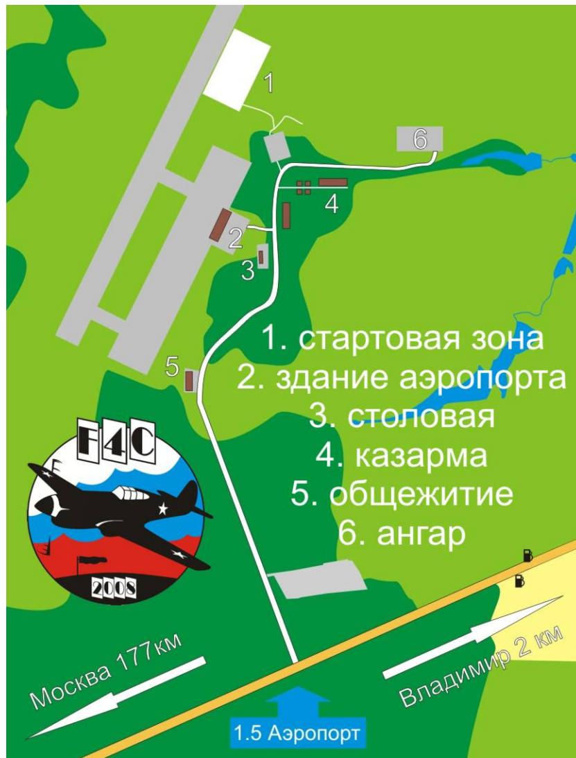
Приложение 1. Карта проезда и схема стартовой зоны.